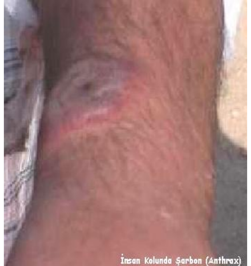
İnsan Kolunda Şarbon (Anthrax)